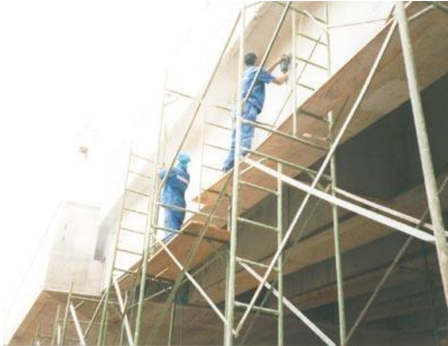
VIADUTO CEM – AV. ÁGUAS ESPRAIADAS.