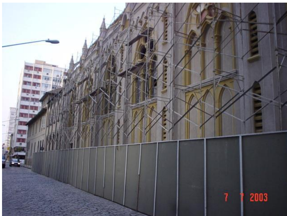
BASÍLICA DE SANTO ANTONIO DO EMBARÉ – RESTAURO DA FACHADA LATERAL ESQUERDA