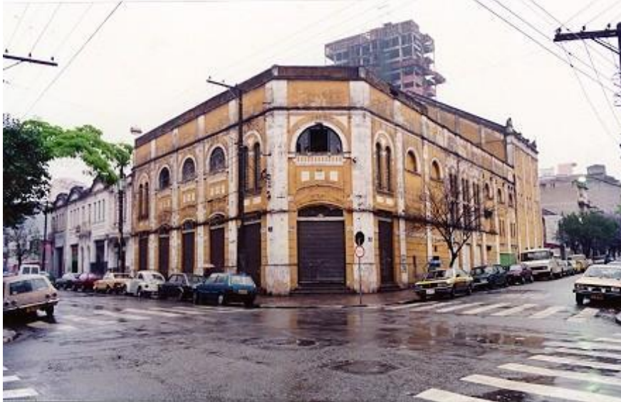
Teatro São Pedro - (antes do restauro).