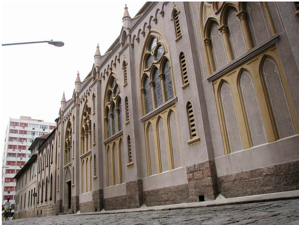
BASÍLICA DE SANTO ANTONIO DO EMBARÉ – LATERAL CONCLUÍDA