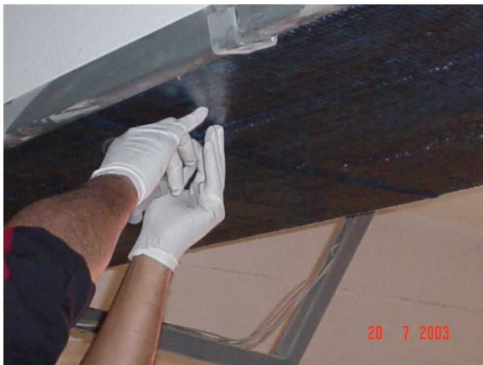
DICA – COMPANHIA ATLÉTICA – REFORÇO ESTRUTURA COM FIBRA DE CARBONO.