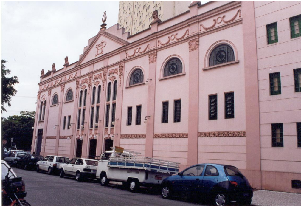
TEATRO SÃO PEDRO – RESTAURO