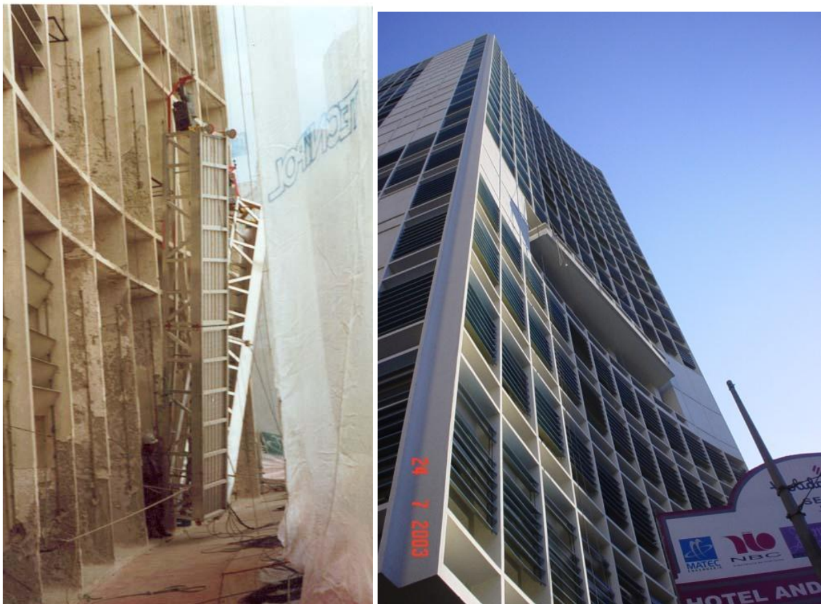
HOTEL JARAGUA – RECUPERAÇÃO E REVESTIMENTO EM PASTILHAS