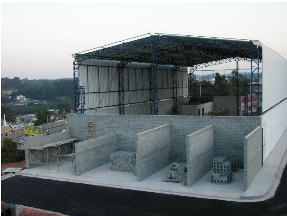
GALPÃO INDUSTRIAL – PROJETO, CONSTRUÇÃO E ACABAMENTO