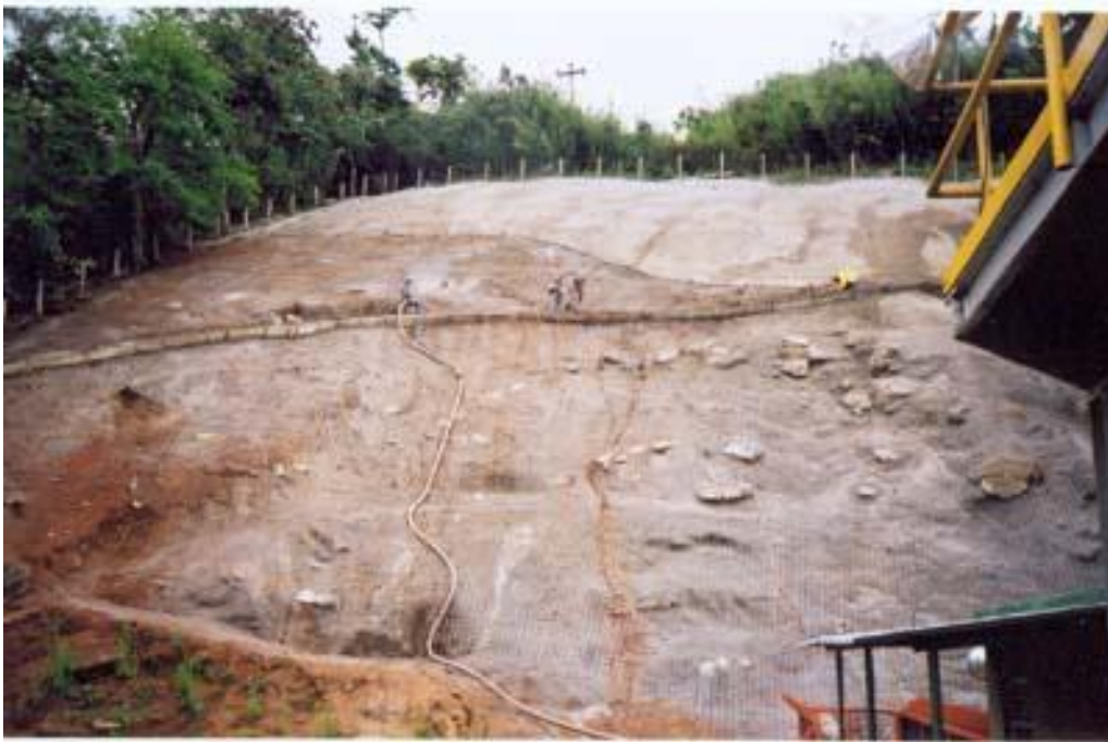
LIGHT RJ – CONTENÇÃO DE TALUDE COM CONCRETO PROJETO (SOLO-GRAMPEADO)