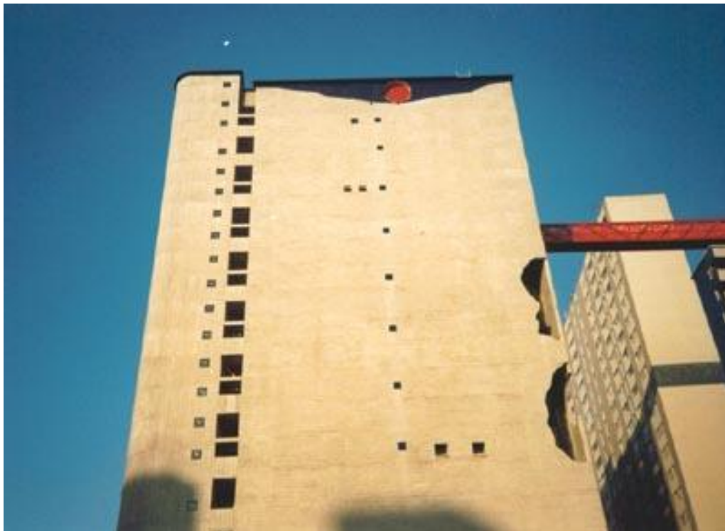
SESC VILA MARIANA – TRATAMENTO DE CONCRETO E PINTURA