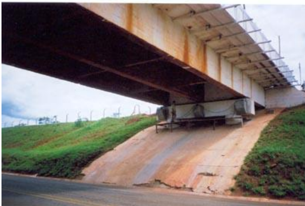
SP VIAS SP 258 KM 336 + 200 – MACAQUEAMENTO DO TABULEIRO PARA TROCA DE APARELHO