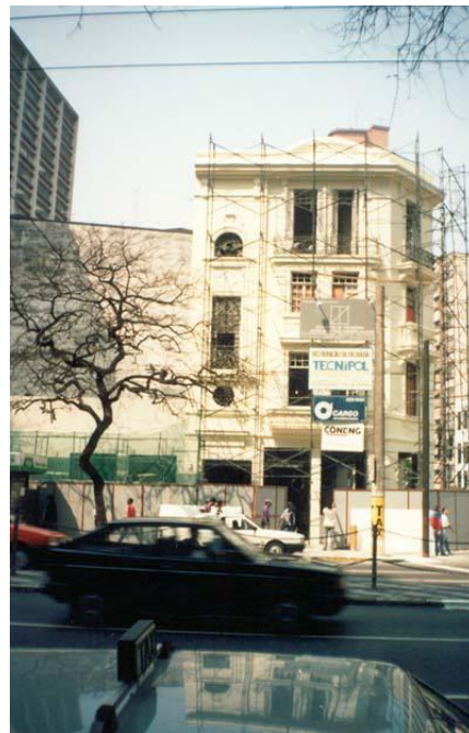
Av. Ipiranga - Centro - São Paulo (após restauro).