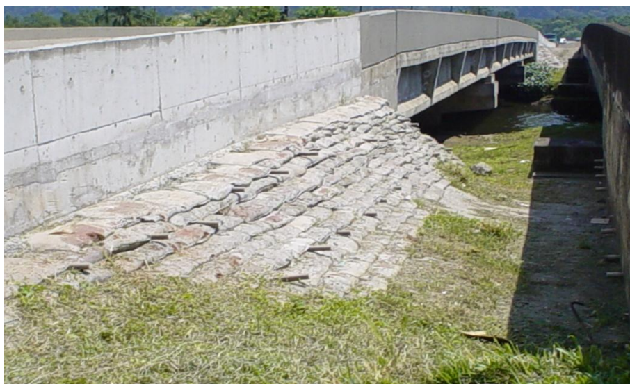
CONCESSIONÁRIA ECOVIAS DOS IMIGRANTES – PONTE SOBRE O RIO QUILOMBO – RECUPERAÇÃO ESTRUTURAL – SOLO CIMENTO.