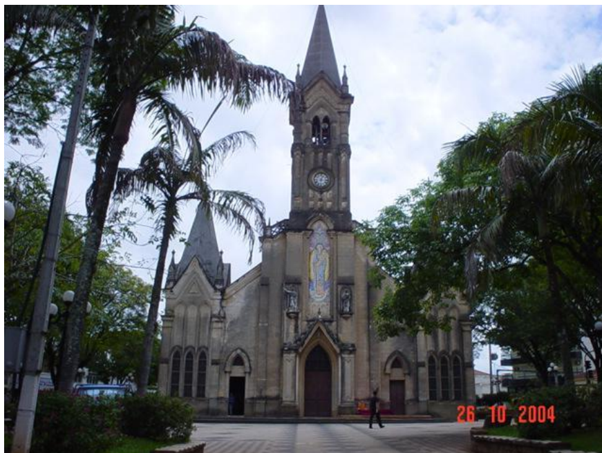
Paróquia de São João Batista - Laranjal Paulista - SP (antes do restauro).