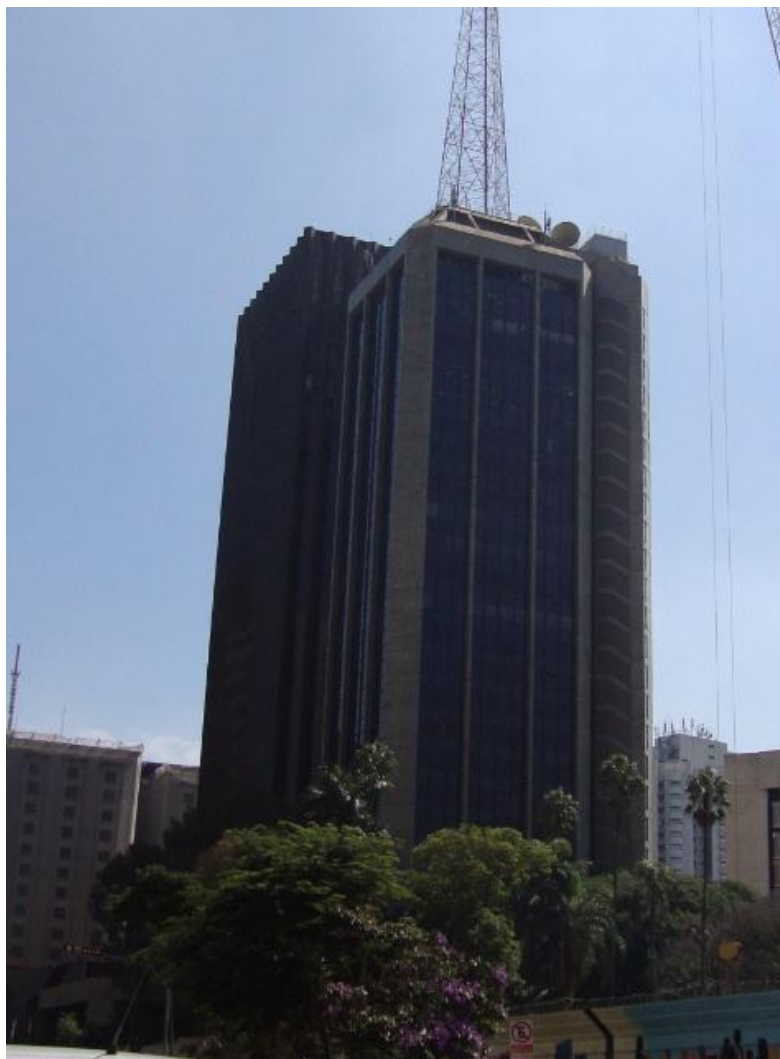
EDIFÍCIO ASAHI – RECUPERAÇÃO E TRATAMENTO DE CONCRETO - CONCLUSÃO 2003