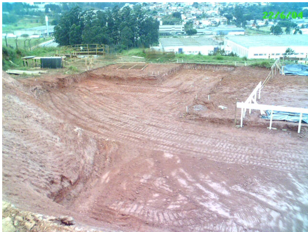
GALPÃO INDUSTRIAL – TERRAPLENAGEM