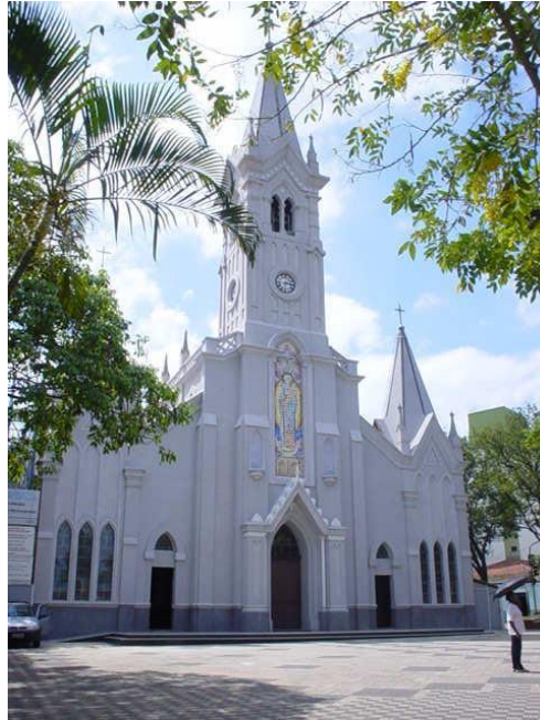
Figura 07 – Paróquia de São João Batista - Laranjal Paulista - SP (após restauro).