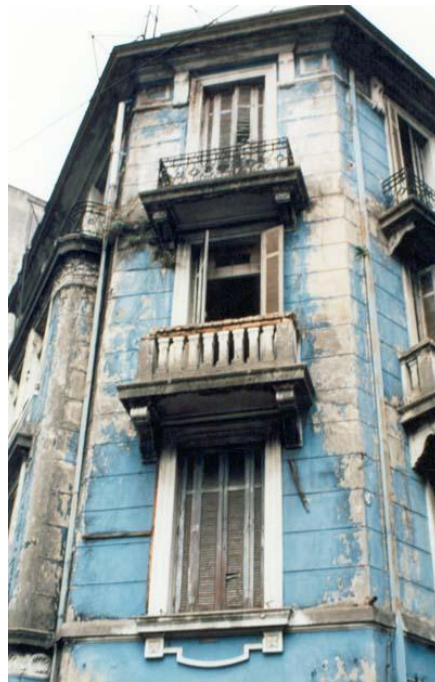
Av. Ipiranga - Centro - São Paulo (antes do restauro).