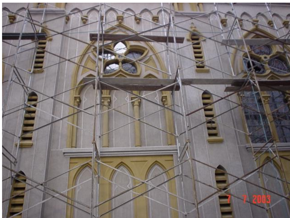
BASÍLICA DE SANTO ANTONIO DO EMBARÉ – DETALHE DO RESTAURO