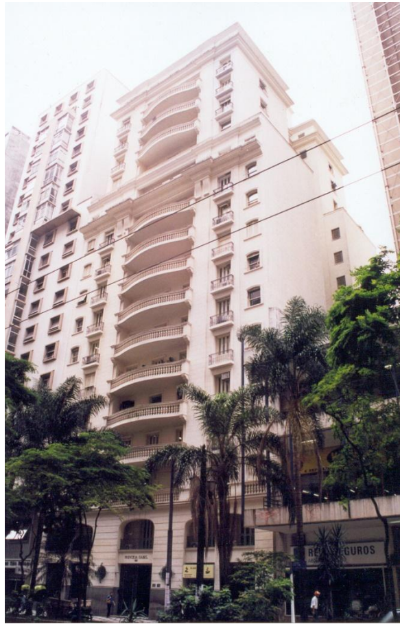
EDIFÍCIO PRINCESA ISABEL – RESTAURO

RECUPERAÇÃO E REFORÇO ESTRUTURAL RESTAURAÇÃO DE FACHADAS REVESTIMENTOS ESPECIAIS OBRAS RODOVIÁRIAS OBRAS CIVIS