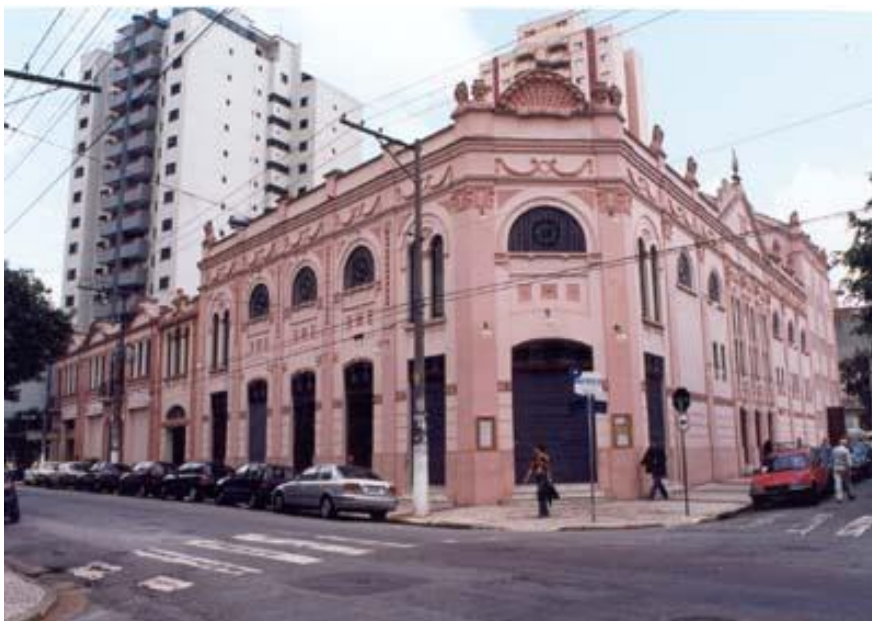
Teatro São Pedro - (após restauro).