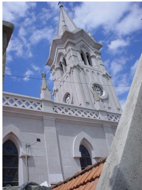
Paróquia de São João Batista - Laranjal Paulista - SP (após restauro).