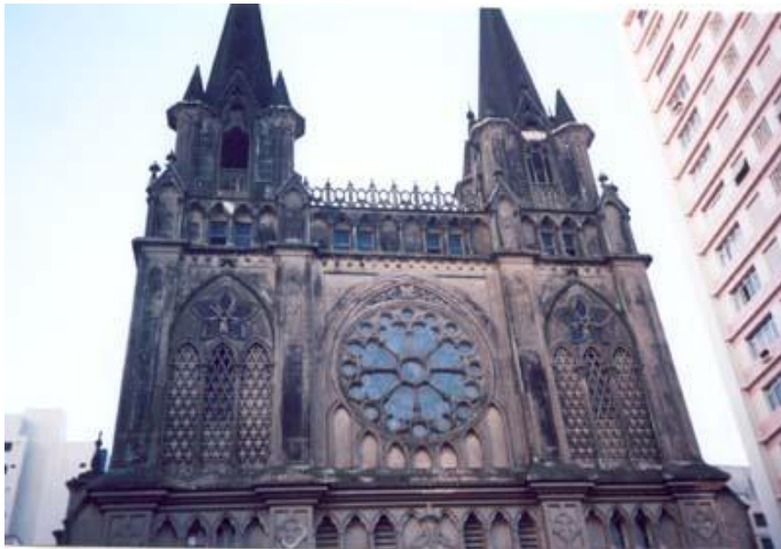
Figura 01 – Paróquia do Embaré - Santos (antes do restauro).