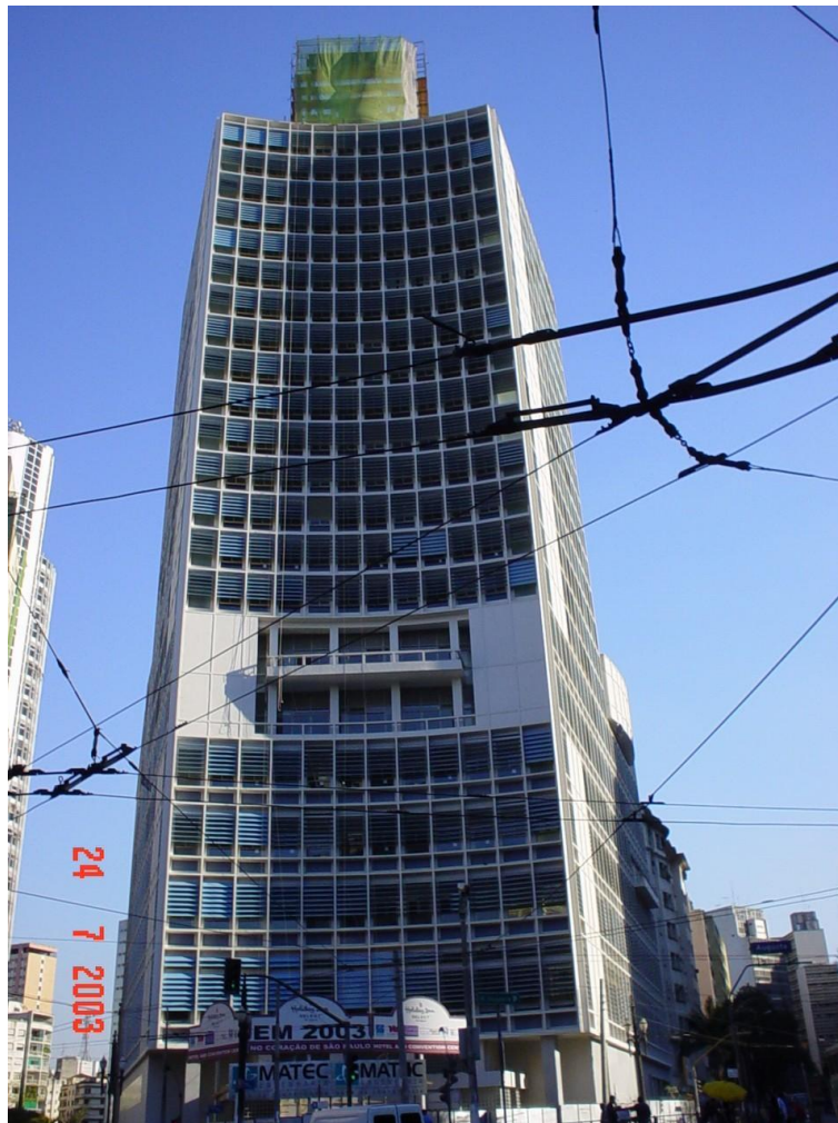
HOTEL JARAGUÁ – REVITALIZAÇÃO DAS FACHADAS